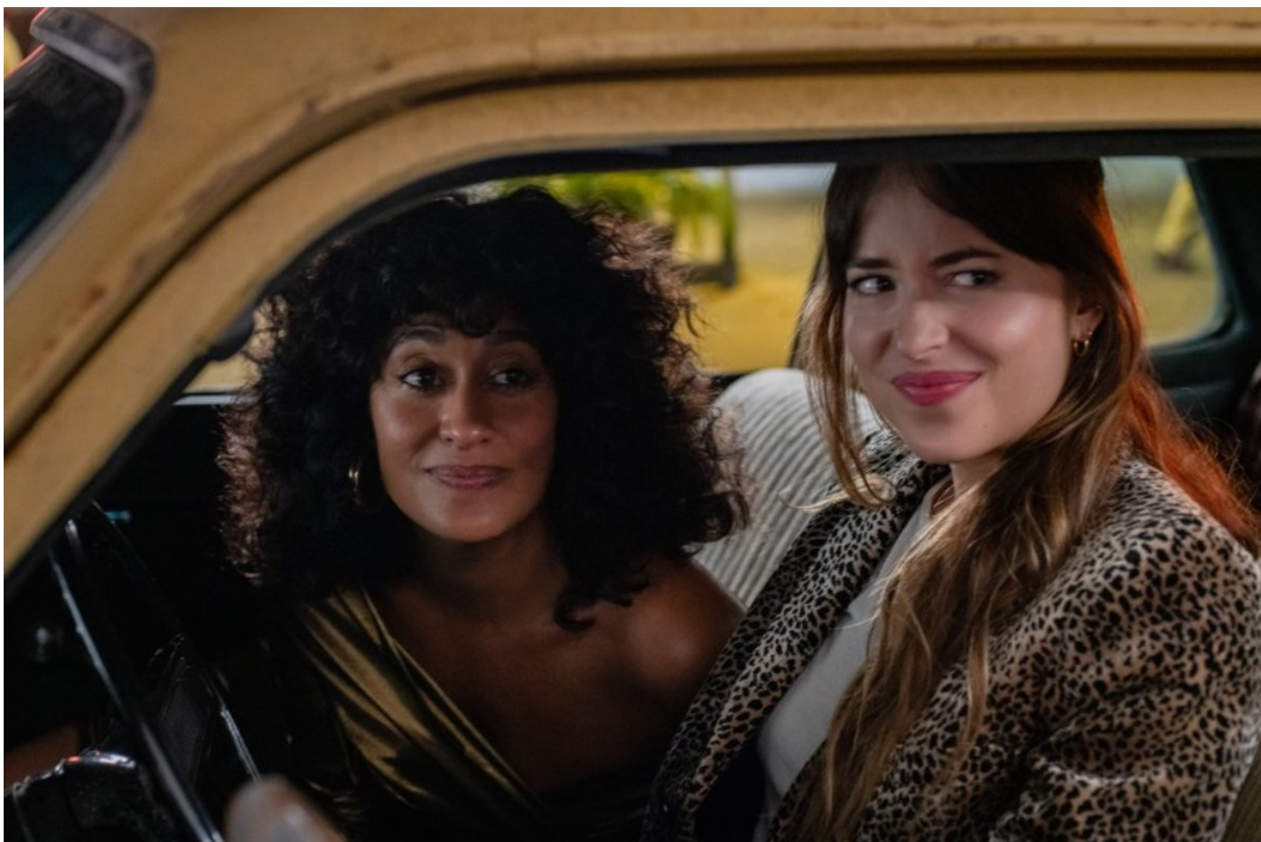
Tracee Ellis Ross (izquierda) y Dakota Johnson, en 'Personal assistant'.

Hace pocos días que los cines han empezado tímidamente a reabrir sus puertas (algunas de las grandes cadenas no están todavía a pleno rendimiento) pero ya se puede constatar un dato, cuanto menos, curioso. Muchas de las películas que se han estrenado estas dos semanas abordan temáticas femeninas e incluso, algunas de ellas, están dirigidas por mujeres. Este es un fenómeno poco habitual en la cartelera que solo suele producirse cuando, por ejemplo, está a punto de celebrarse un campeonato importante de fútbol como el Mundial o la Eurocopa. ¿Será casualidad o ya estaba previsto así antes de que se aplazase este último torneo que iba a iniciarse, justamente, la próxima semana?