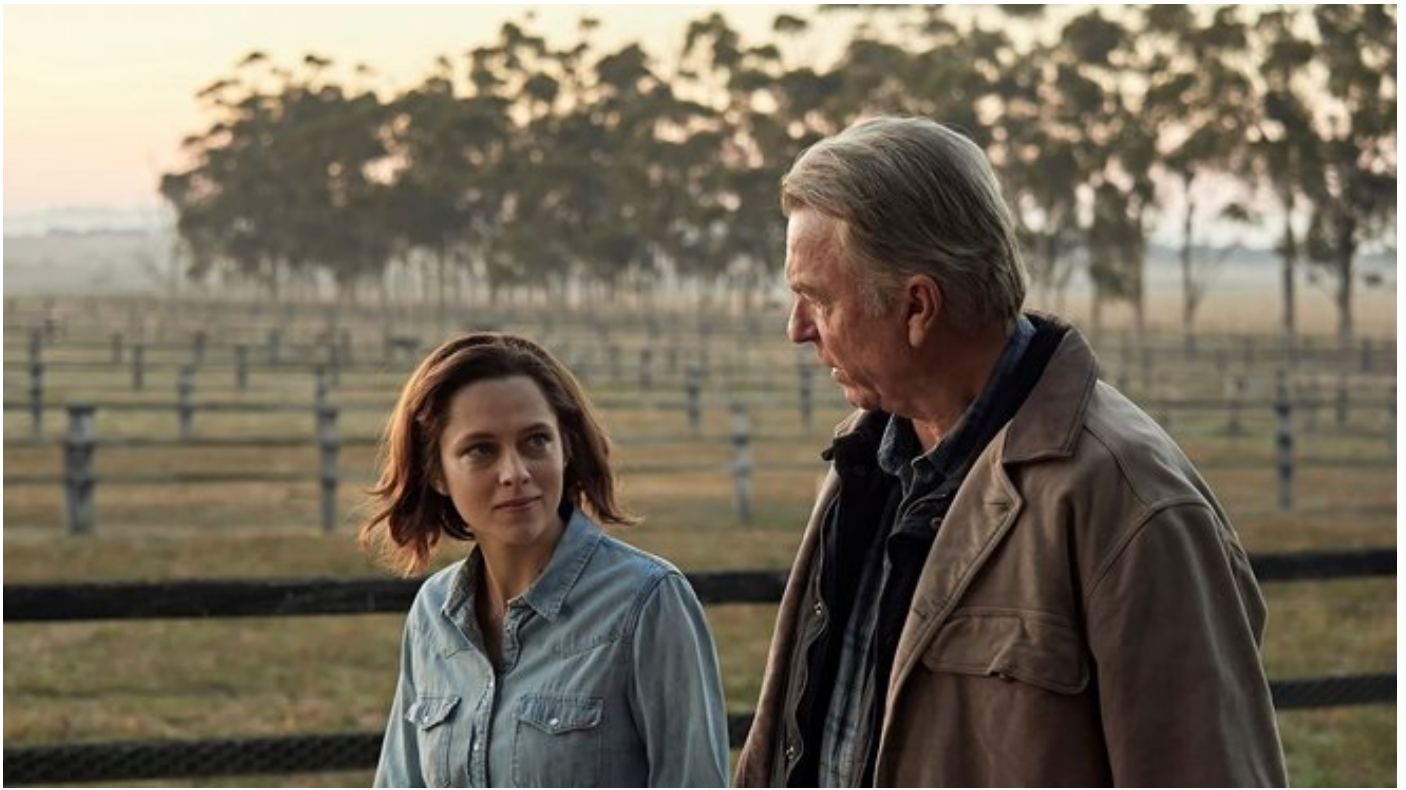
Teresa Palmer y Sam Neill interpretan a la jinete y su padre.

Cuenta hasta el último detalle de los elementos que influyen en el desarrollo de una competición como el estado de la hierba, el momento de atacar, etcétera y los esfuerzos que debe hacer diariamente hasta el punto de casi carecer de vida personal. Los paisajes, bellamente fotografiados, contribuyen a la plasticidad. Es una tónica historia de superación personal muy previsible , pero que se deja ver y entretiene lo justo.