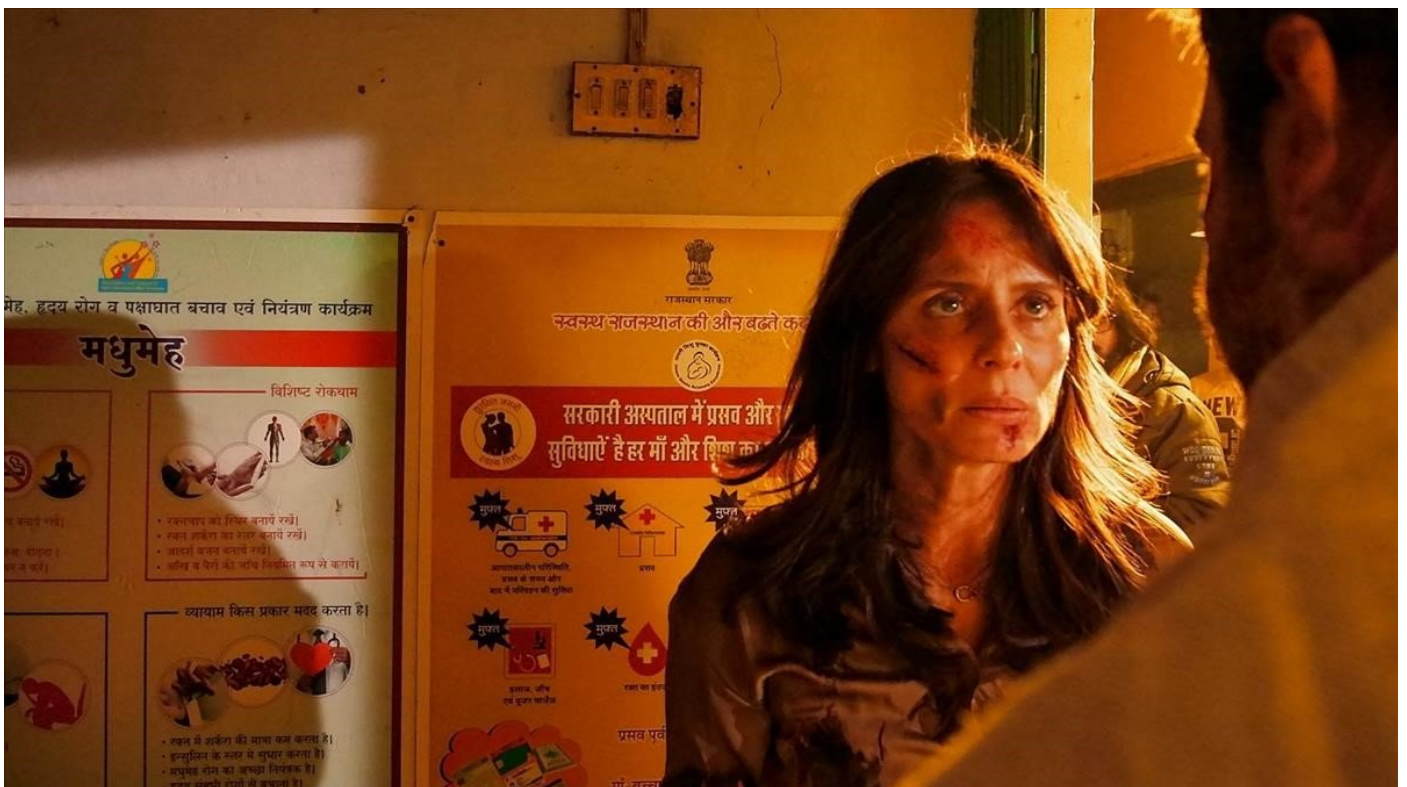
Aitana Sánchez-Gijón, en 'La cinta de Álex'.