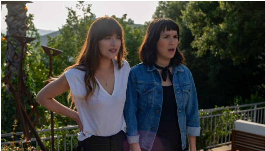
Dakota Johnson protagoniza Personal Assistant