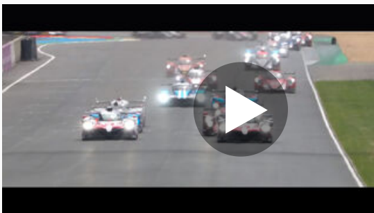
Trailer de las 24 Horas de Le Mans 2019