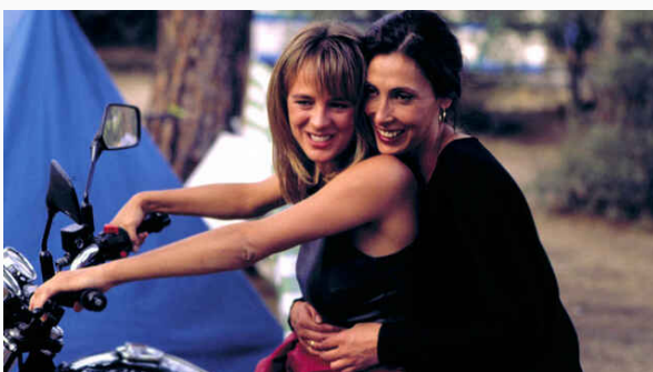
FLIXOLÉ se va de veraneo con el mejor cine en español