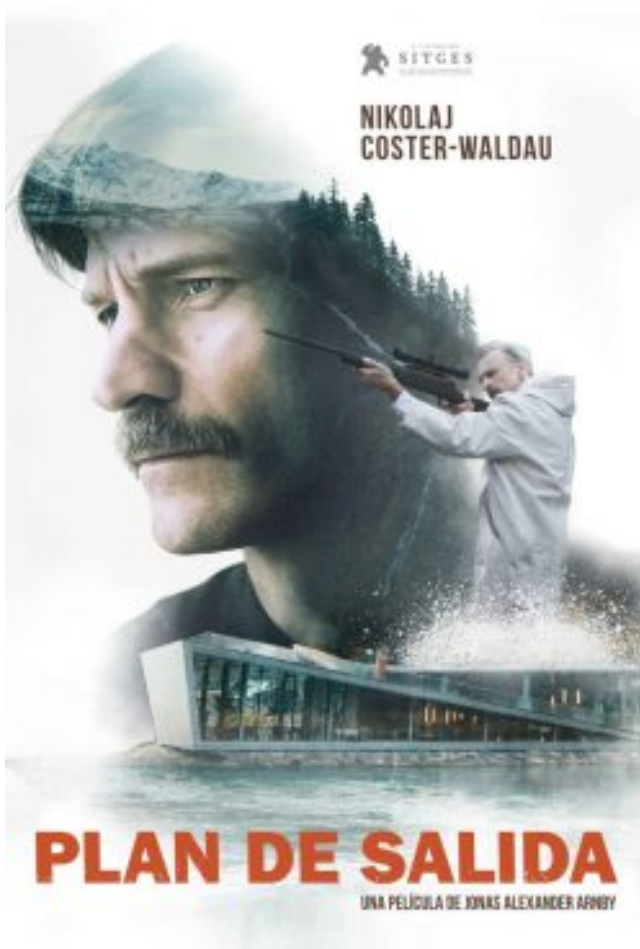
Plan de salida