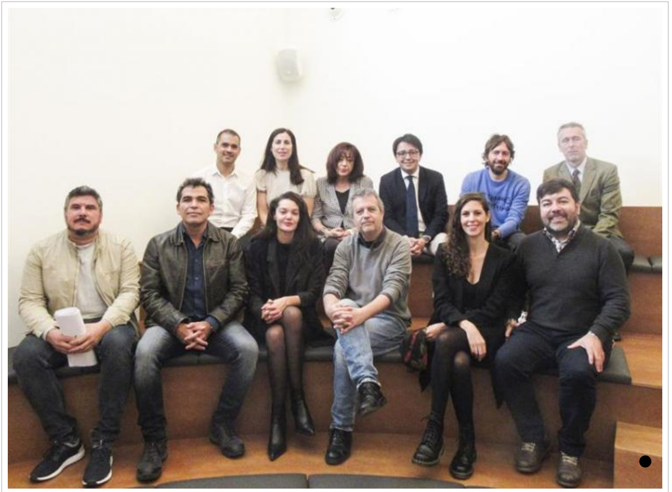
Jurados de las secciones competitivas de Fical

Los jurados del Certamen Nacional de Ópera Prima y del Concurso Internacional de Cortometrajes del Festival Internacional de Cine de Almería (Fical) se han reunido este lunes en el céntrico espacio 'Day one' de CaixaBank en Madrid para deliberar los premios de la XVIII edición, que se celebra del 16 al 23 de noviembre.